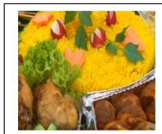
@ UPIT, RO, Eveniment de gătit