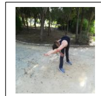
@ CARDET, CY, Cursuri de Yoga