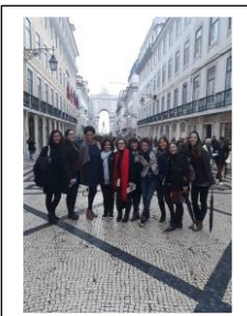
@ ISQ, PT, 0 zi la muzeu