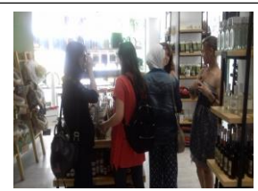
@ CARDET, CY, Vizită la un magazine de produse aromatice