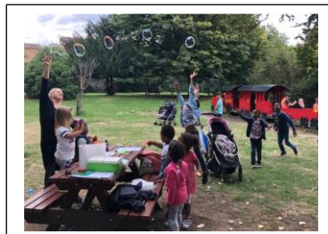
@ LU, UK, Picnic internațional