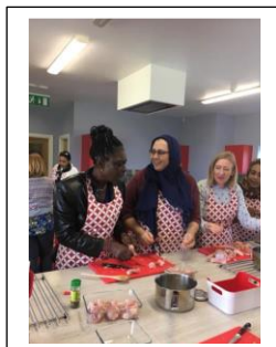
@ Meath Partnership, IE, Să gătim împreună