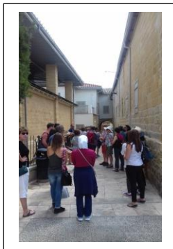
@ CARDET, CY, Un tur de o zi în orașul gazdă

Aceste rețele au luat o serie de forme și s-au bazat pe circumstanțele individuale din fiecare țară și pe nevoile exprimate ale femeilor imigrante.