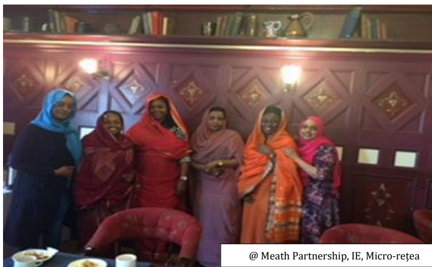
@ Meath Partnership, IE, Micro-rețea